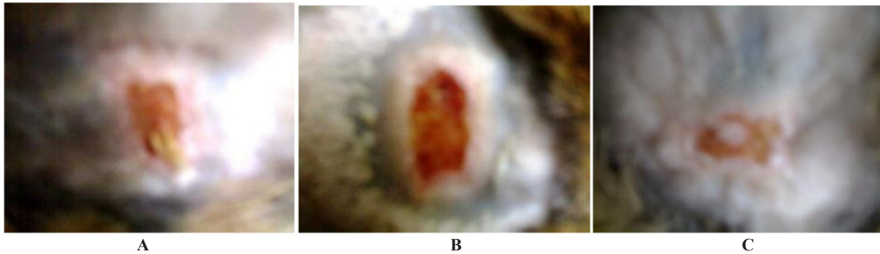
Gambar 2. Luka perlakuan pada hari ke-12 untuk kelompok dengan pemberian krim 0.5% (A), 1% (B), dan 2% (C).

lambat dari semua konsentrasi meskipun ada beberapa kelinci terjadi reduksi pada daerah luka tetapi masih tetap terjadi inflamasi yang ditandai dengan masih adanya darah dan pada bagian tengah luka masih belum sembuh.