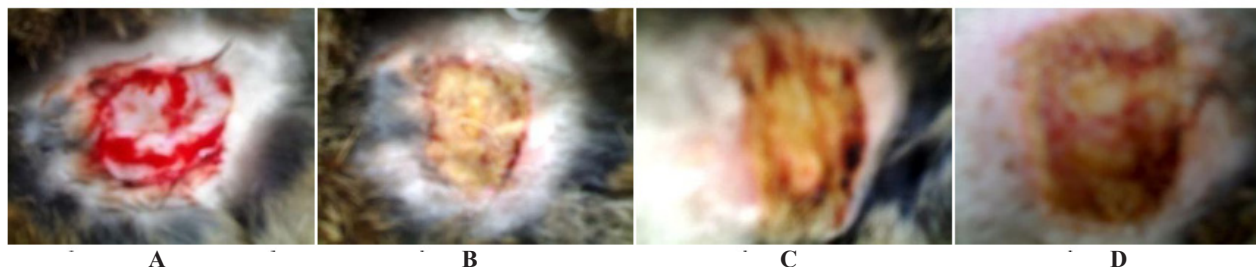
Gambar 1. Luka perlakuan pada hari ke-3 untuk kelompok kontrol (A), kelompok dengan pemberian krim 0.5% (B), 1% (C), dan 2% (D).

Dari gambaran histopatologi pada semua konsentrasi sediaan krim dan kontrol menunjukkan adanya perbedaan histologi kulit yang terbentuk antara penggunaan ekstrak air ikan gabus dan kontrol yang tidak diberikan ekstrak air ikan gabus. Pada pemeriksaan histologi dilakukan pengambilan kulit yang sudah sembuh pada hari ke-12 untuk satu ekor kelinci pada masing-masing kelompok. Sedangkan pengambilan kulit kelinci sebagai kontrol negatif hanya dilakukan satu kelompok pada satu ekor kelinci. Ini diasumsikan bahwa semua kulit kelinci dianggap mempunyai gen yang sama. Hal ini dilakukan karena pertimbangan biaya dan dari hasil pengamatan foto juga dapat dilihat kelompok kontrol mempunyai daya penyembuhan yang