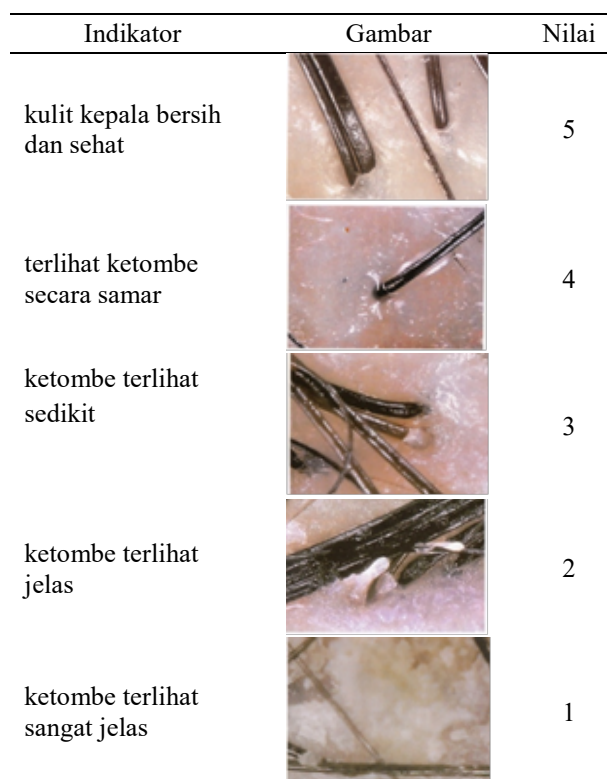
Tabel 1. Kriteria penilaian kondisi kulit kepala.

perhitungan, penelitian ini menggunakan lembar observasi penilaian kondisi kulit kepala (Tabel 1).